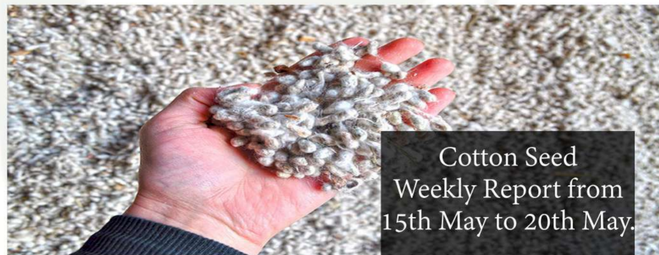
Cotton Seed Weekly Report from 15th May to 20th May.

This week, the price of cotton seed has declined, in which a decline has been observed from Rs. 25 per quintal to Rs. 125 per quintal in the major stations of Central, North and South all three zones. Know how the cotton seed market was in the whole week.